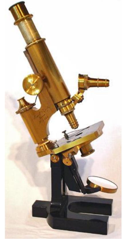
Mikroskop Carl Zeiss 1879

Beide Firmen, die Optik-Firma von Carl Zeiss und die Glas-Firma von Otto Schott, waren damals und sind heute noch sehr erfolgreich. Viele teure Kameras und Teleskope haben Linsen ( lenses ) oder Objektive von Carl Zeiss.