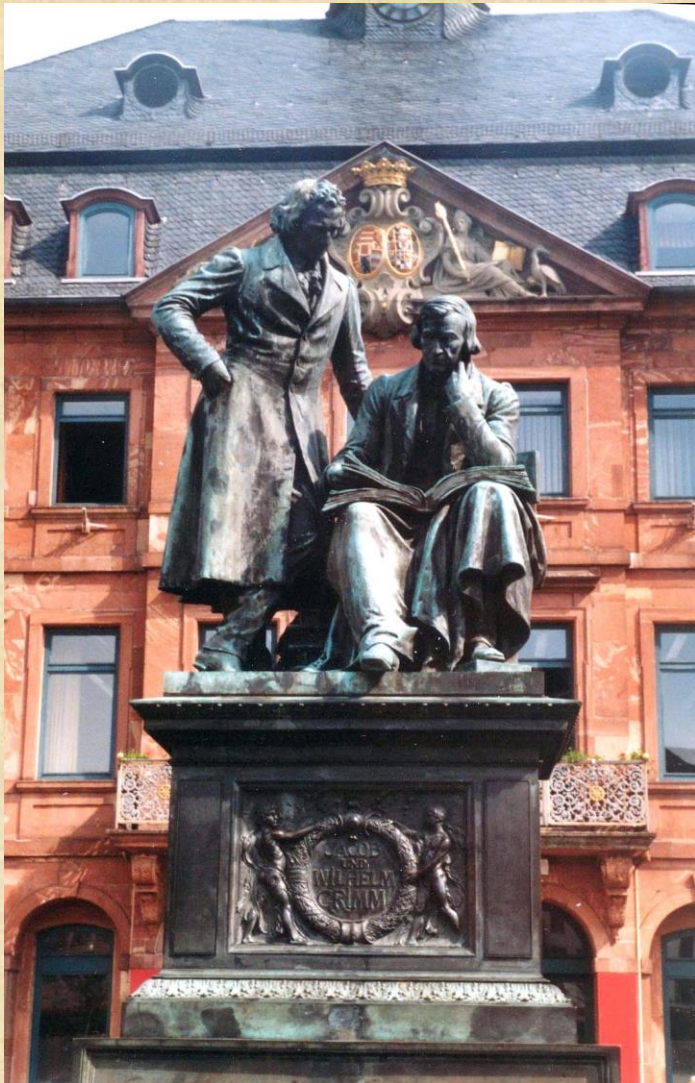
Brüder Grimm Denkmal in Hanau

Die Brüder Grimm sind weltbekannt für ihre Sammlung von Märchen. Sie waren aber auch Sprach- und Literaturwissenschaftler. Jacob (1785-1863) und Wilhelm (1786-1859) wurden in Hanau, in der Nähe von Frankfurt, geboren. Sie haben in Kassel die Schule besucht und dann in Marburg Rechtswissenschaften studiert. In dieser Zeit haben sie angefangen, sich für alte deutsche Literatur, die deutsche Sprache und Folklore zu interessieren.