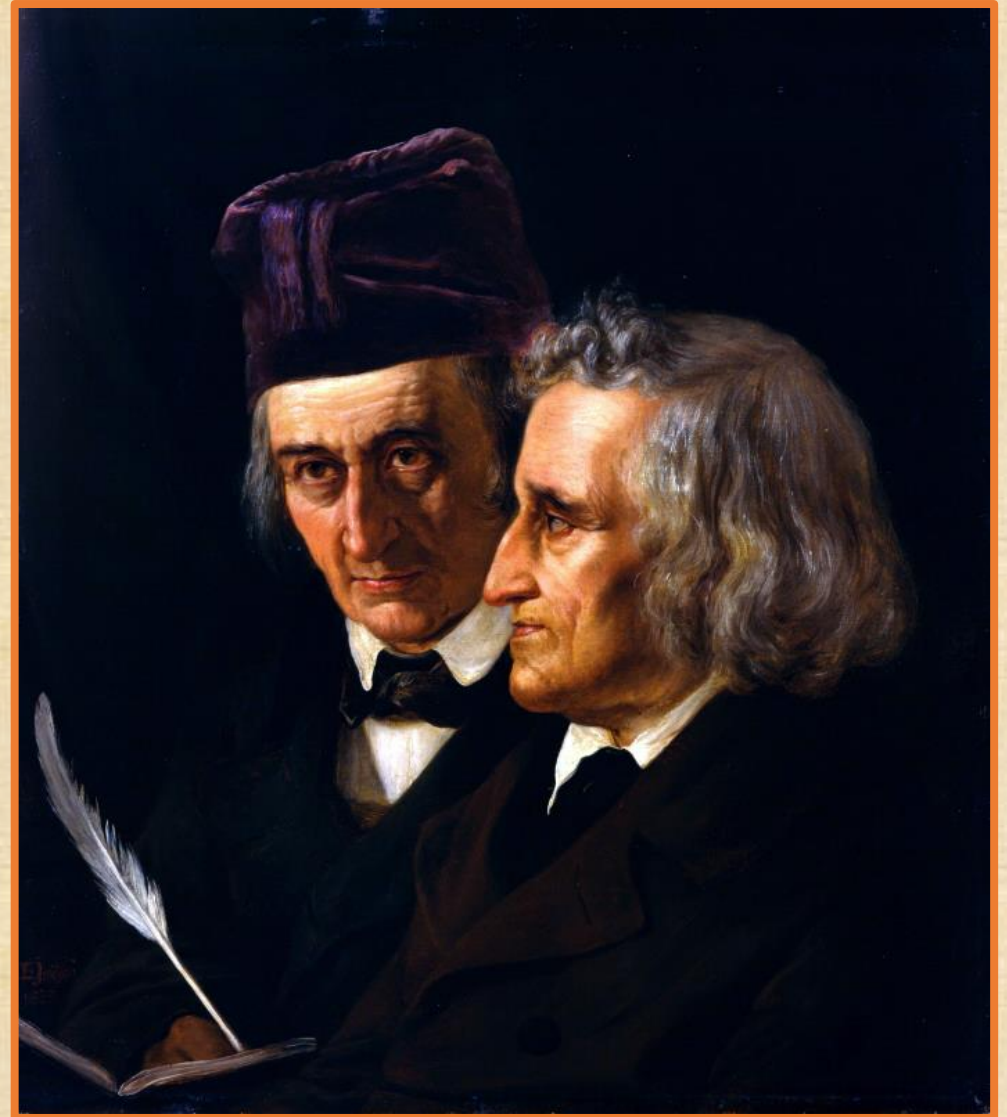
Doppelporträt von Elisabeth Jerichau-Bauman 1855