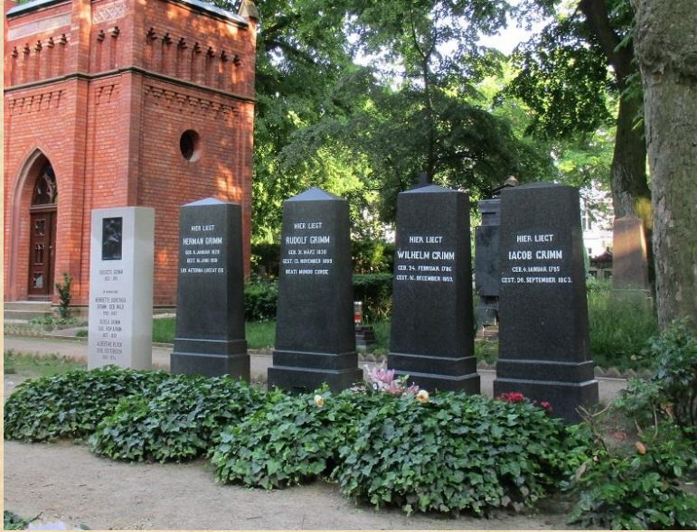
Grab der Brüder Grimm in Berlin-Schöneberg